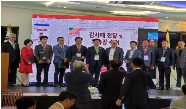
아총연 임원 위촉장 수여