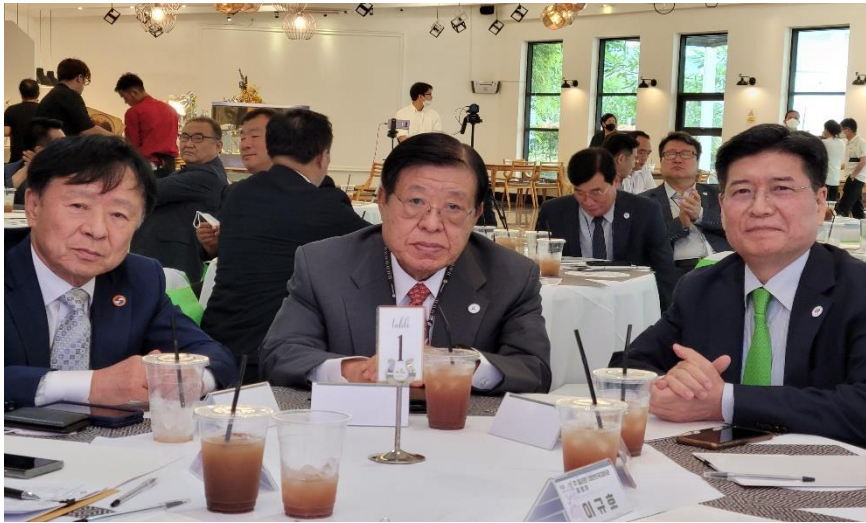
(정기총회 1부 기념사진)