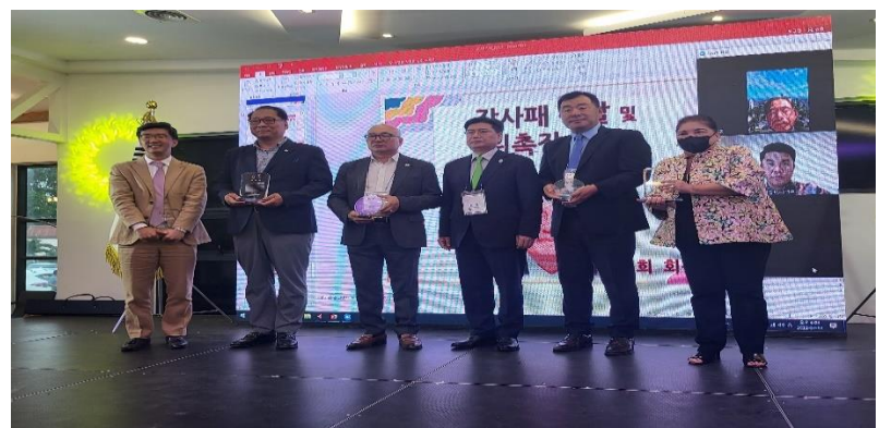
대회 준비위원 및 외빈 감사패 수여